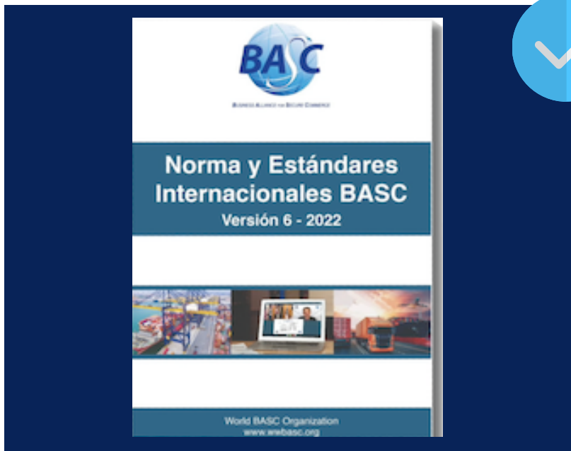
Haga clic en la imagen para acceder a la memoria del Lanzamiento de la Norma y Estándares BASC V6-2022.